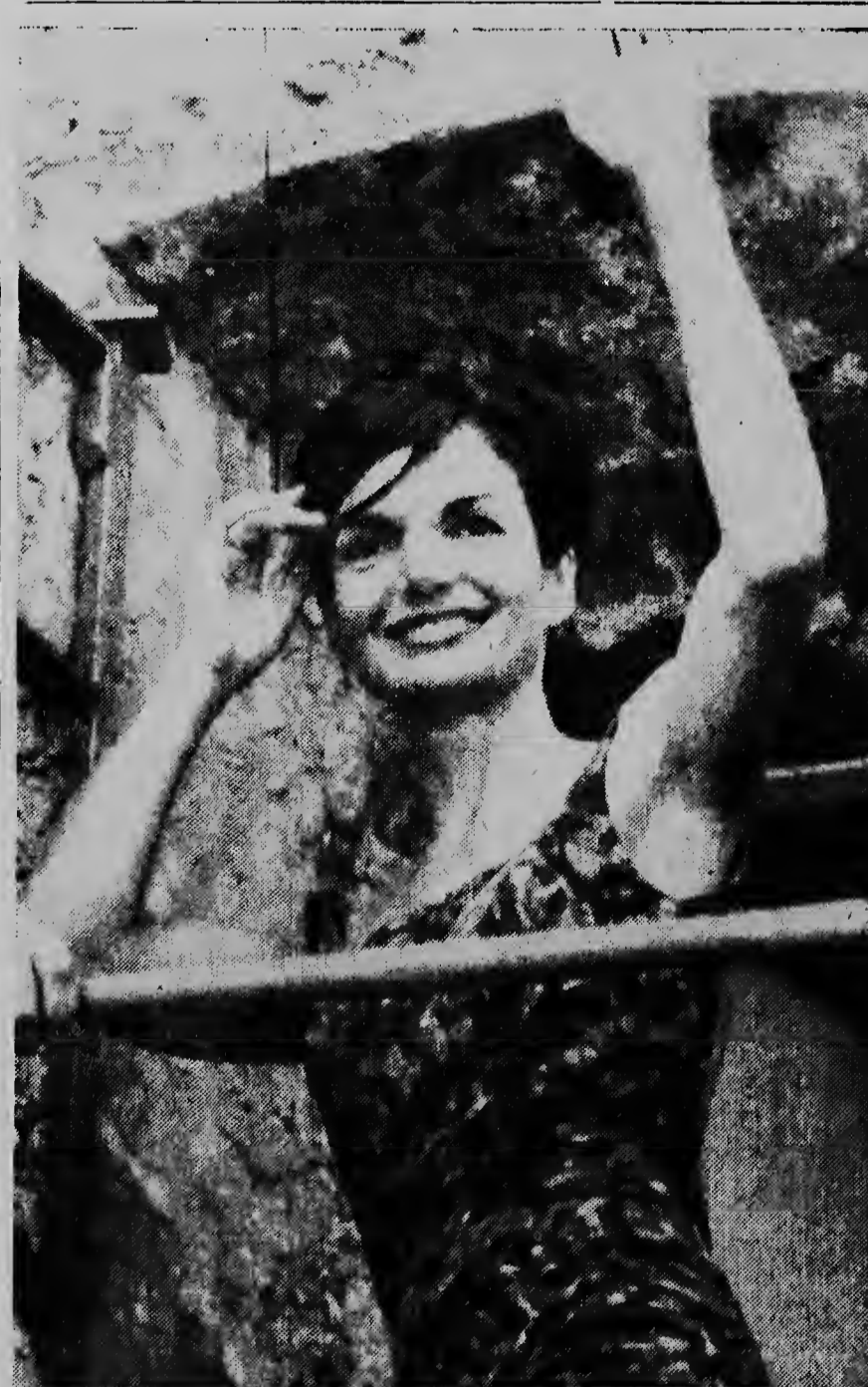
Sra. Jacqueline Kennedy, esposa di president Kennedy di Estados Unidos ta pasando actualmente huntu cu su ruman muher, princesa Lee Radziwill, un vacacion di dos siman na Ravello na Italia. Ora cu Jackie a bai landa na Conca del Marino, na Amalfi, contentu el a hiza man salud e fotografonan cu na kier a perde e ocasion aki pa immortaliza e figura elegante aki na traje di banjo.